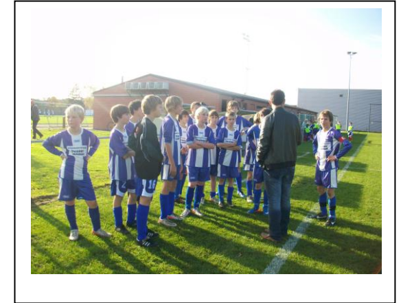
Trainer Cottyn geeft zijn team de nodige instructies.