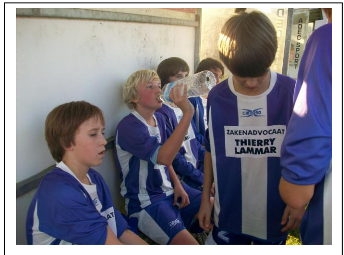
Blijvende concentratie tijdens de rust...