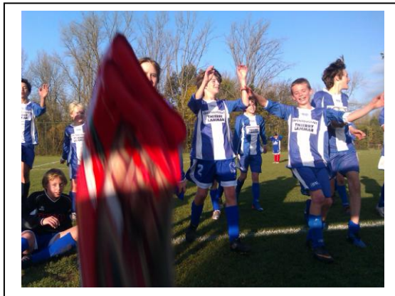
Feestje na het inblikken van de Virgo !